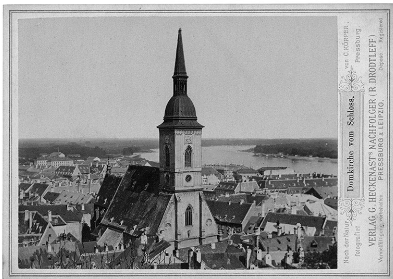
Obr. 1 Körper, Karol: Dóm sv. Martina od Hradu , z albumu Pamiatka na Prešporok (album 26 voľných listov, 1880 – 1890), fotografia, 1880 – 1890. Zdroj: Slovenský národný archív, Bratislava, dostupné on-line: < http://dvekrajinu.sng.sk/dielo/SVK:TMP.76 >.

Cirkevný hudobný spolok pri Dóme sv. Martina v Bratislave (ďalej len CHS) vznikol za účelom zabezpečovania sakrálnej hudby počas bohoslužieb. V maďarsko-nemeckom štatúte CHS z roku 1834 sa v bode 1 uvádza, že cieľom spolku je sprevádzať hudbou bohoslužbu na väčšiu Božiu slávu s dobre obsadeným orchestrom v tomto dómskom a mestskom farskom chráme v nedele a sviatky, ako aj v dňoch narodenín a menín Jeho Veličenstva cisára a kráľa. 3 Spolok mal zmiešaný zbor a orchester a venoval sa aj výchove hudobníkov. Spájal profesionálne hudobné výkony (dirigent, sólisti)